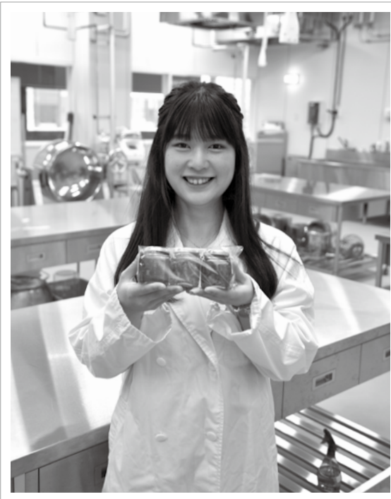
ジャムの売上金10万円を医療従事者支援のために日本財団に寄付した