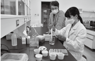
花の機能性を調べるためにポリフェノールを抽出する実験

商品名、ラベルのデザインまで、仲間と話し合っ て考案。花の良さを生かすため特にジャムと花 の色合いにこだわりました。農家の方に「あり がとう、助かった」と言われた時は、とてもう れしかったです。自分の研究が誰かの役に立つ と気づき、新鮮な気持ちでした。 就職を考えていましたが、ジャム作りを経て、 大学院でもっと学び たいと思うようになり ました。今後は、 食用花の栄養素を使 った新しい商品開 発を目標に研究を続 けたいです。