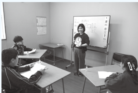
時計の読み方を学ぶ生徒

2024年度の市立小・中学校に在籍する外国籍児童・生徒は584人。そのうち半数を超える約300人が日本語の指導が必要でした。「あぷれ」では、年間50人程度の子どもたちを受け入れる計画です。