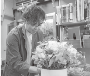
直感を大切にして、花を組み合わせる

たい思いや物語を大切にしています。同じ種類でも、表情はさまざまです。オーダーに沿ったデザインに仕上げるため、色や大きさなど最適な花を選び仕入れています。渡す時に最もきれいな姿になるように花をお湯に浸したり、たたいたり、ひと手間を加えることもあります。 何種類もの花を組み合わせた作品が、お客さんの笑顔につながるのが何よりの喜びです。 これからも一人一人に寄り添い、特別な時間に彩りを添える花を届けたいです。