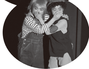
過去の公演の様子