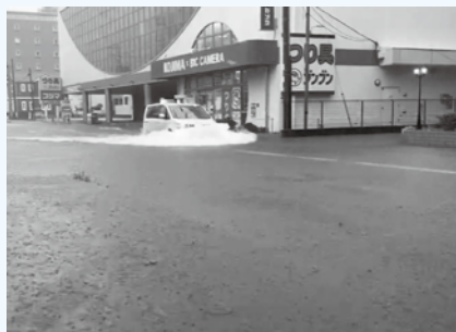
2021年7月3日に発生した冠水

台風や集中豪雨時の冠水に備え、国道129・246号の厚木郵便局前交差点西側で新たな雨水管を整備しました。雨水は県道603号(上粕屋厚木)の下を通る雨水管に流れ、恩曾川に排出されます。