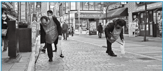
ボランティアを募集

《対象》①市内在住在勤在学で応募日現在18歳以上②平日の会議（5回程度）に出席できる③他の審議会などの委員ではない④市の議員・職員ではない⑤の全てを満たす方2人《任期》9月から1年間《報