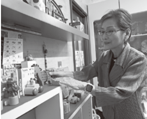
遊び方を実演して紹介する

長持ちするため、子どもから孫の代まで長く使えるのも魅力です。海外の物は、カラフルな色使いの物が多く、遊び心のあるデザインも気に入っています。店では木の良さを感じてもらえるよう、箱から出して商品に触れられる工夫をしています。子どもたちが目をキラキラさせながら夢中で遊ぶ姿を見るのが、うれしい瞬間です。 子どもの頃に、好きな物で思い切り遊んだ記憶は一生の思い出になります。子どもたちの笑顔を増やせるおもちゃをこれからも届けたいです。