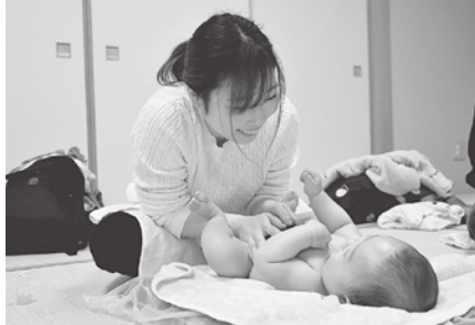
《「子育て」は4面に続きます》

6月13日、10時30分～11時30分。あつぎ市民交流プラザ。オイルを使ったマッサージで赤ちゃんとの関わり方を学ぶ。市内在住の保護者15組（生後1～6カ月の赤ちゃんを同伴。保護者は1組2人まで）。300円（オイル代）。㊦5月13日～6月4日に子育て支援センター☎225-2922へ。抽選。㊦