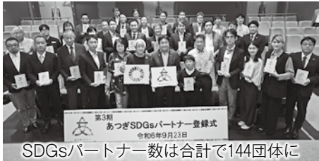
SDGsパートナー数は合計で144団体に

☎市HPにある申請書を、Eメールで7月31日までに企画政策課 ☎1100@city.atsugi.kanagawa.jpへ。