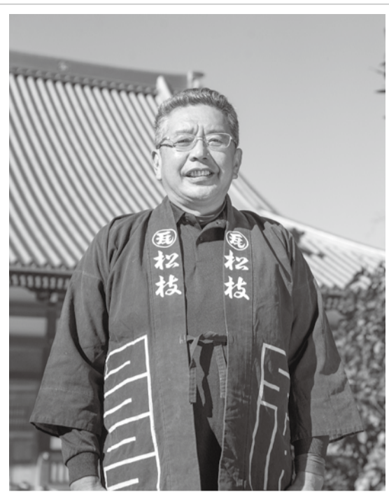
今年11月に現代の名工に選ばれた。市内では古民家岸邸や清源院などの瓦ふきを手掛けた