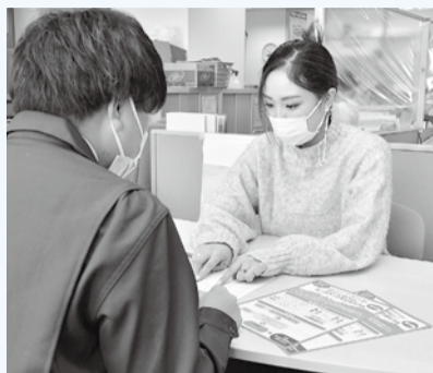
第5弾は11～12月に申し込みを受け付けた