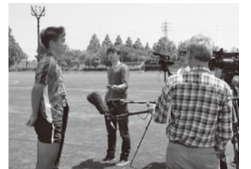
現場に出向き、自ら取材することも

らないこともありましたが、しかし今では、何度も打ち合わせを重ね、目的を共有することで、納得のいく作品を作れるようになりました。読者から「面白かった」「手に取って良かった」などの声を聞いたときは、本当にうれしいです。最近ではサッカー以外にも興味が広がってきました。勤めていた時に携ったカメラは今では趣味になり、魅力を伝える書籍を作っています。これからも、読者に面白いと思ってもらえるような本を作っていきます。