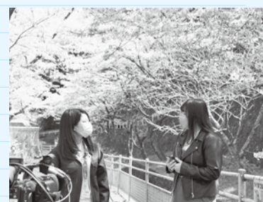
満開の桜を背景にレポート

で、皆さんもぜひ応募してみてくださいね。レポート中、たくさんの花びらが降ってきてきれいだなと思うのと同時に、散っていくのが少し寂しくもありました。見られる時期が限られているからこそ、季節の移ろいが美しく感じられるのかもしれない。昨年に引き続き感染対策が欠かせませんが、春ならではの景色を楽しみたいですよ。花見や旅行の代わりに、写真を通して春を楽しんで、フレッシュできればいいなと思いました。