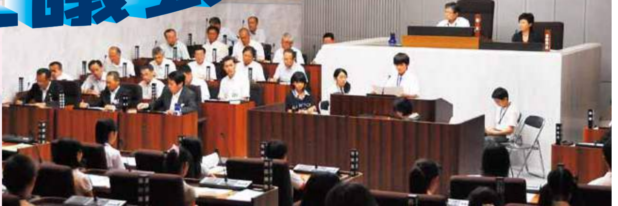
平成26年に開催された第1回あつぎ子ども議会