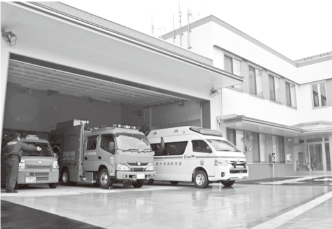
煤ヶ谷に開設した清川分署は市内の消防・救急活動にも当たる