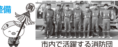
市内で活躍する消防団

市では、平成27年度に社会貢献広報事業の助成金を活用し、消防団の編み上げ式ゴム長靴を購入しました。