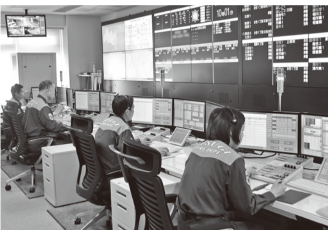
指令センターの整備で通報から出動までの時間を短縮

こうした問題を改善するため、清川村の消防事務が市に委託され、清川分署を開設しました。新たに、高規格救急自動車や消防ポンプ自動車を配備