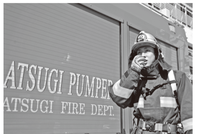
デジタル無線で情報をより効率よく、確実に伝達

「デジタル無線」を導入しました。これにより災害の情報をいち早く確実につかみ、迅速に出動できる体制を整えました。 素早い出動により、到着までの時間が短縮され、市民の皆さんの大切な命や財産を守ることに繋がります。市は、市民の皆さんが安心して安全に暮らせるまちを目指して、今後も消防力の強化に取り組んでいきます。 消防総務課 ☎223-9366 (高機能消防指令センター・消防救急デジタル無線は指令課 ☎221-2331)