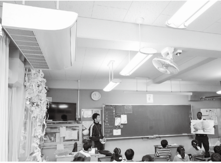
冷暖房設備の導入で年間を通して快適な教室に