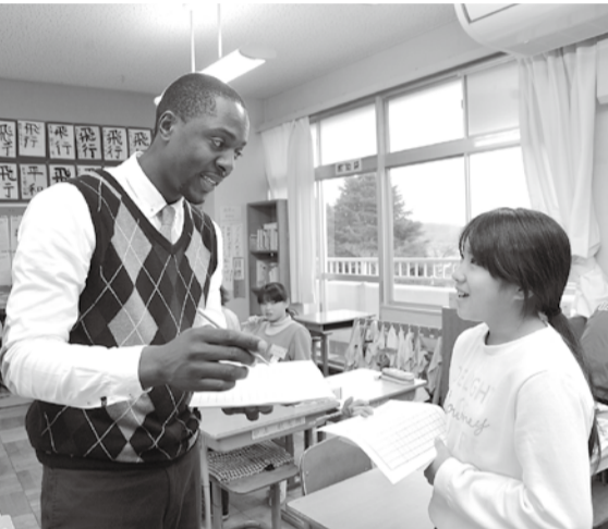
外国語指導助手との会話が英語力を高める

小・中学校への冷暖房設置に取り組んでいます。同年度中には、全ての中学校への設置が終了。26年度からは小学校への設置を開始し、今年度、全校への設置が完了します。