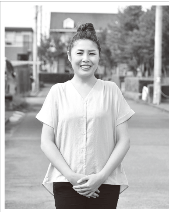
「受け取る人には『すみません』と思うのではなく、フードロスの課題に貢献しているのも忘れないでほしい」と話す