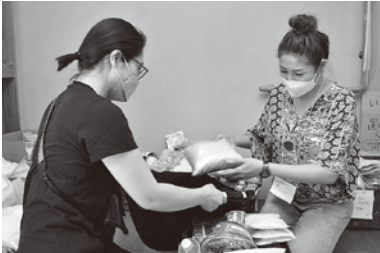
食品は市内の農家などからも寄付されている

親家庭に対象を絞り、賛同してくれた仲間4人と、食品集めや仕分けなどを行っています。 子どもはみんな、生まれた時は真っさらで、伸び伸び育とうとする生き物だと思います。どんな状況でも、未来ある子どもが少しでも生きやすい世の中であってほしいです。 パントリーが、受け取りの場だけでなく、親子が地域や人とのつながりを感じてほっとできる場所になったらうれしいです。