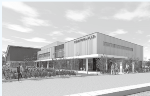
ふれあいプラザの完成予想図