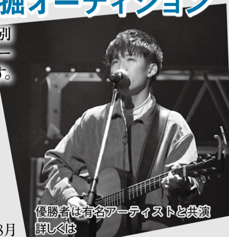
優勝者は有名アーティストと共演 詳しくはあつぎミュージックフェスティバル 検索

☎文化生涯学習課や市HPにある応募用紙に、音源1曲分(CD-R)と参加費を添え、直接または現金書留で7月31日(必着)までに〒243-8511文化生涯学習課 ☎225-2508へ(音源は市HPからも提出可)。