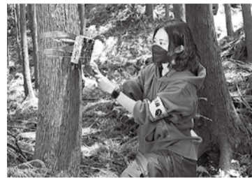
記録した映像はSNSで発信している