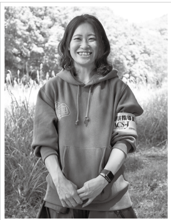
「野生生物のたくましく生きる姿はカッコいい!」と笑顔