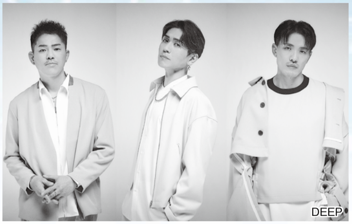
他にも多数のアーティストが出演予定