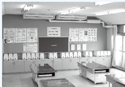
上依知小学校の家庭科室に設置された冷暖房設備

子どもたちが快適な学習環境の中で安心・安全に学校生活を送れるよう、今年度から、家庭科室や理科室などの特別教室に冷暖房設備の設置を進めています。取り付けは、2026年度に完了予定です。