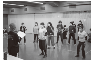
週に一回の練習では、30人の出演者が演技の流れを確認している

ミュージカルは初挑戦で、歌だけでなく、体での表現や息の合った演技が求められます。週一回の定期練習に加え、家事や仕事の休憩時間に本番をイメージしながら自主練習を重ねています。当日は、来てくれた人や息子たちに精いっぱい頑張る姿を見てもらいたいです。