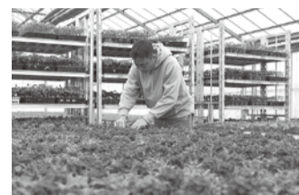
育てた花は夢末市やホームセンターなどに出荷

見た人に癒やしを与えてくれるのが花の魅力だと思います。これからもたくさんの人に喜んでもらえるよう、真心込めて育てていきたいです。