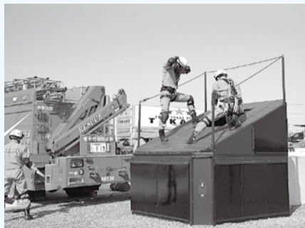
倒壊した建物を想定した訓練が可能に