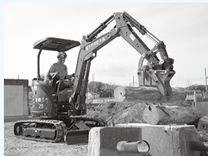
県央地区で初めて導入した災害対応用重機