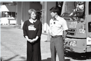
秋の火災予防運動に合わせ防火のポイントを確認

いつも訓練に打ち込む消防隊員や、地域で活動する消防団の皆さんが居てくれるのはとても心強いですね。私も、できることから火災予防を心がけようと思います。