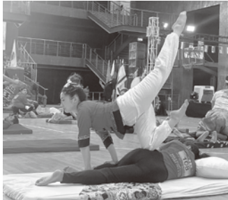
世界大会では4部門に21カ国、約600人が参加した

て技を勉強。お客さんの体の状態に合わせて施術を組み立てられるようになり、今年5月に施術の流れや美しさを競う世界大会で準優勝できました。 大会後は講座も開くようになりました。多くの人にタイ古式マッサージの魅力を知ってもらうため、セラピストたちに培った技術や経験を伝えています。業界を盛り上げ、これからもお客さんを笑顔にしていきたいです。