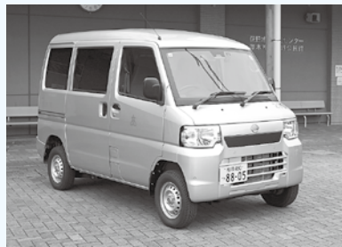
30年までに全ての公用車の電動化を目指す（特殊な車両を除く）

二酸化炭素などの温室効果ガスの排出量を実質ゼロにするカーボンニュートラルを2050年に達成するため、公用車の電動化を進めています。来年3月までに11地区の公民館に電気自動車を導入。今後も計画的な転換を進めていきます。