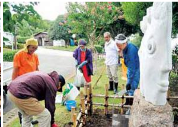
ぼうさいの丘公園の「あつぎ素敵美術館」