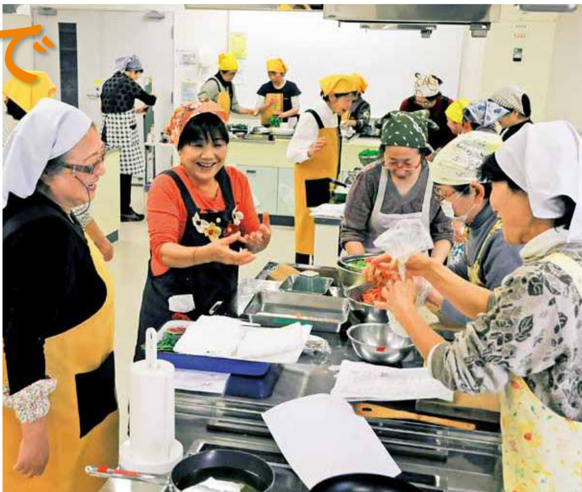
厚味会が実施する料理教室。黄・黒の2色エプロンが会員の目印