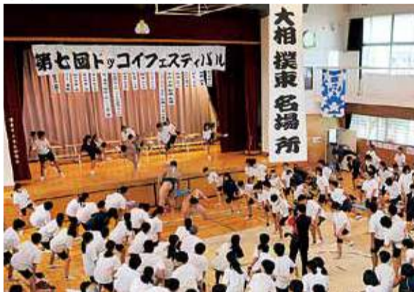
東名中での相撲教室「ドッコイフェスティバル」