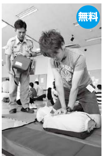
救急隊員が丁寧に指導