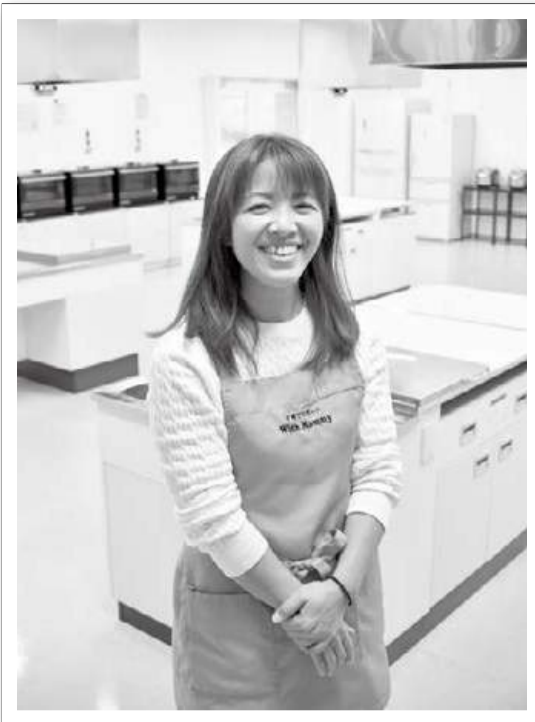
子ども食堂の会場は市民交流プラザのキッチンスタジオなど。夢は、市内に産前産後ケア施設を開くこと