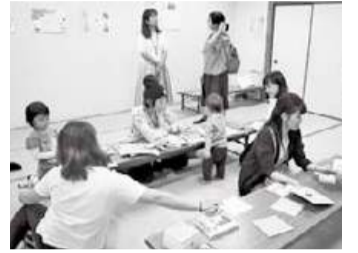
初めは参加者だった仲間と「ママカフェ」を運営

4月から、市の市民協働提案事業として「ママカフェあつぎ子ども食堂」を始めます(3面に関連記事)。おいしくて体に良い献立を考えているので、たくさんの人に来てほしいです。子どもたち、そして親たちが、笑顔になれる場所にしたいと思っています。