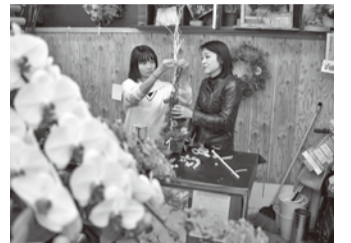
教室には幅広い年代が訪れる