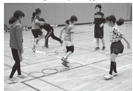
《「講座」は4面に続きます》

いずれも南毛利スポーツセンター。☎ハガキ、ファクス、Eメールにイベント名、〒住所、氏名(ふりがな)、年齢(◆は学年)、電話番号を書き、12月25日(必着)までに〒243-0039温水西1-27-1市体育協会☎247-7212・☎248-7151・✉info@atsugi-taikyo.or.jpへ。抽選。