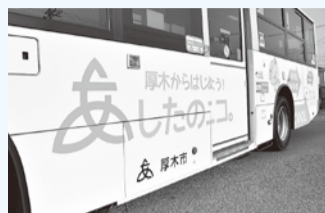
市内を走るバスで呼び掛け一人一人ができること