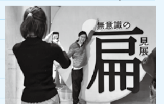
目印の撮影スポットでパシャリ

普段、何気なく口にしてしまう「普通」という言葉も、他の人からすれば「普通」ではないかもしれません。自分の考えもしっかりと持ちつつ、相手の「普通」に寄り添う気持ちも大切にしたいと思いました。