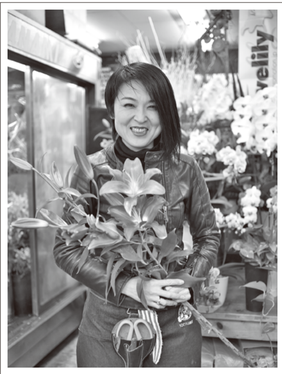
市内のバラやカーネーションの魅力も広めたいと意気込む