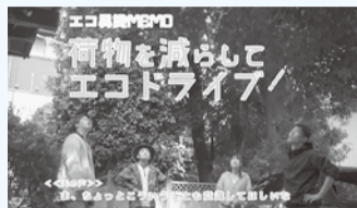
エコになると思っていた行動が、実は間違っていたという物語

エコのためにできることを紹介するPR動画を作成。家電や車、荷物の配達などの場面で、どんな選択がエコになるのかを考える。