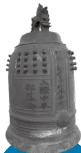
半鐘は高さ約50cmで、重さは25kgほど。火事などを知らせる役割を担っていた

戦時中、日本全国の鐘の9割が失われたといわれ、返却されることはまれです。博物館では、この鐘を10月1日まで展示します。幸運にも生き延びた「戦争を語る生き証人」を、ぜひご覧ください。