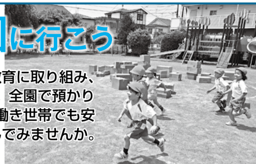
10月から幼児教育・保育無償化がスタート