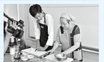
夏バテ予防レシピの作り方をレポート