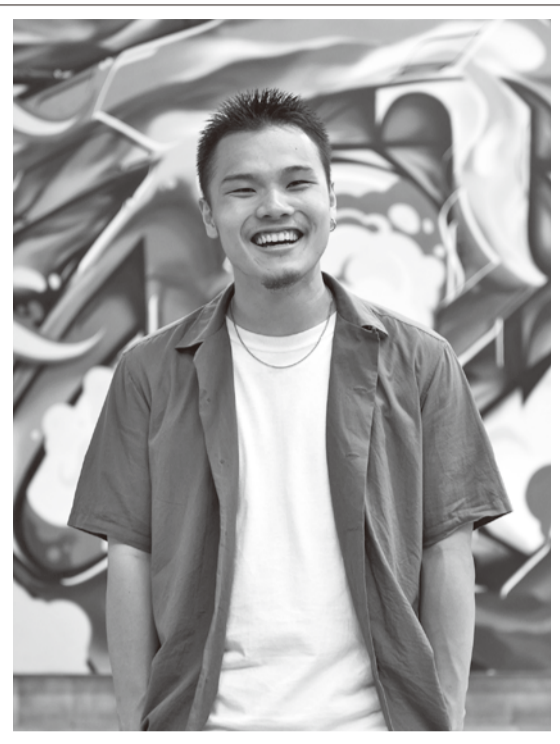
初めて出場を果たした8月の世界大会で4位を獲得