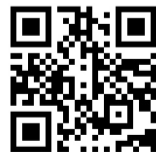
講座予約システム▶

講座予約システムがスマートフォンでも見やすく生まれ変わります。講座の申し込みには事前登録が必要です。