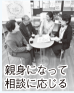
親身になって相談に応じる