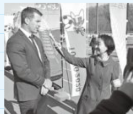
調印式は荻野運動公園で開催

幅広い年齢層の市民が一丸となってNZの皆さんを迎え、交流を深めた素晴らしいイベントに立ち会うことができ、本当にうれしく思います。この夏の東京大会がますます楽しみになりました。