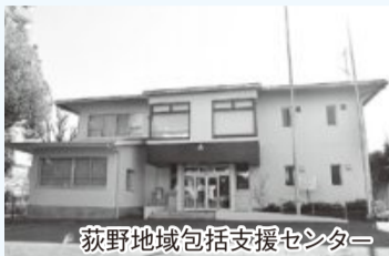
荻野地域包括支援センター