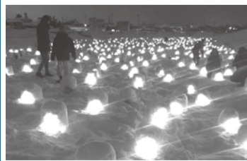
明かりが幻想的な「かまくら」

☎ハガキ、ファクスに〒住所、氏名(ふりがな)、年齢、性別、電話番号を書き、12月13日(必着)までに〒243-8511企画政策課 ☎225-3732へ。抽選。1月下旬に事前説明会を実施。