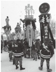
300年の歴史を誇る祭り「ぼんでん」

日にち 2月15～17日(2泊3日) 対象 市内在住の18歳以上15人 費用 4万円(宿泊費、保険料など)