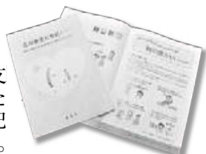
ガイドブック「この街とともに…」

障がいの特性や求められる支 援などを分かりやすくまとめた ガイドブックを市役所などで配 布しています(市HPにも掲載)。