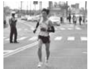
昨年度はかながわ駅伝に出場

冬場は、駅伝シーズンが始まります。学校や市などを代表してたすきをつなぐ駅伝は、チームのために走ります。プレッシャーもあるけれど、みんなで良い走りをして喜び合いたいです。