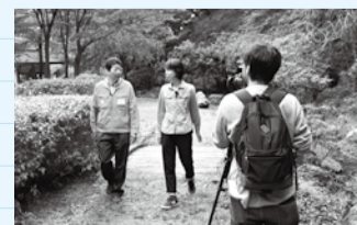
公園の職員と園内を散策

木々に囲まれ、ゆっくり深呼吸すると、体の中に良い気が取り込まれていくのを感じました。全国でも数少ない森林セラピー基地に認定されていることも納得です。紅葉の季節は、慌ただしい日常を離れて、自然の中でゆったりと過ごすひとときを皆さんにお薦めしたいです。