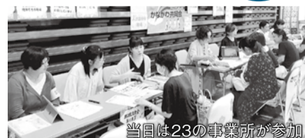
当日は23の事業所が参加

介護事業所や障がい児者支援施設での仕事に興味がある方向けに、就職相談会を開催します。 《日時》 11月30日 15~19時 《会場》 保健福祉センター 《内容》 市内の施設担当者による就職相談や採用のための相談会 ☎当日直接会場へ （入場は18時30分まで） ☎介護福祉課 ☎225-2240