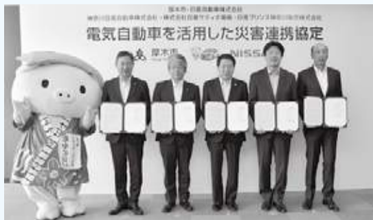
締結式では協力して市民の安心を守ることを約束