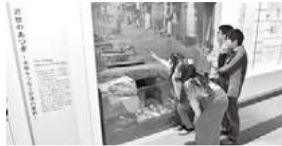
古写真は歴史を伝える貴重な資料

何でしょうか。なぜ、きれいに写っ ているのでしょうか。答えが分か った先着20人の方には、粗品を差 し上げます。いろいろな視点で古 写真を楽しみ、歴史に思いを馳せ てみてはいかがでしょうか。